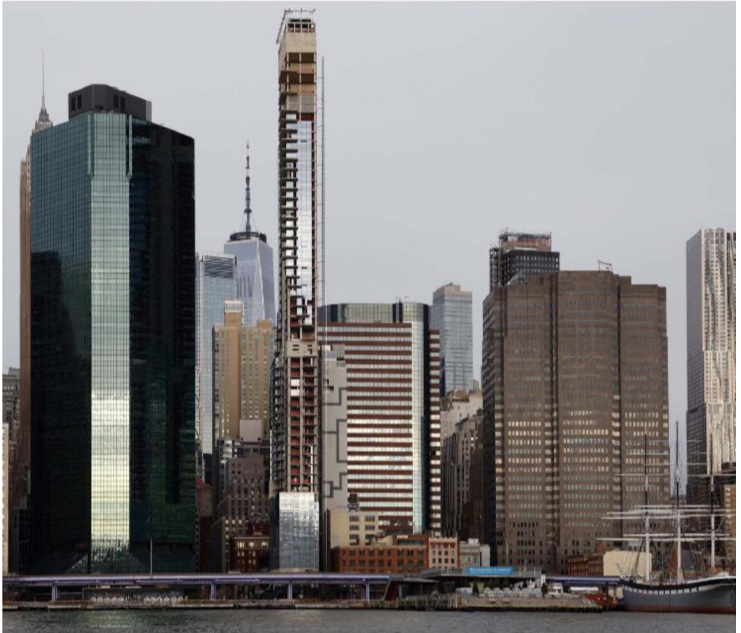
Centraal op de foto: 1 Seaport of 'The Leaning Tower of New York'. Het gebouw staat er al jaren onafgewerkt bij.